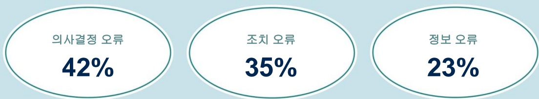
인적 오류(HOOEY & FOYLE, 2006)

항공 관련 의사결정 오류는 일반적으로 사소한 실수나 부주의가 아니라 착오입니다. 다시 말해서, 문제는 올바른 결정의 불이행이 아니라 애초에 잘못되거나 부실한 결정을 내리는 데 있습니다. 계획은 의도한 대로 진행되지만, 머지 않아 현재 상황에 적합하지 않거나 부적절한 것으로 판명됩니다. 이러한 이유로 의사결정 오류를 진실하고 정직한 착오라고 합니다.